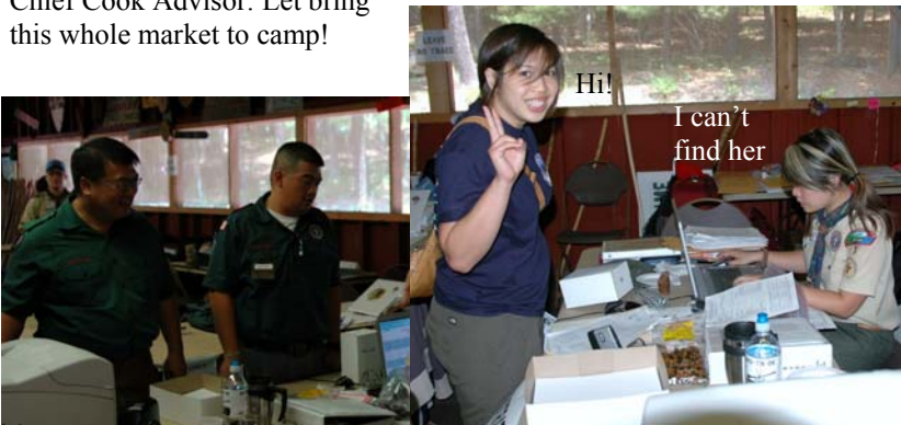
Hi! I can't find her