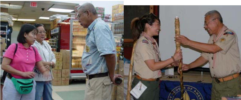
Quarter Master: What is your menu for next week?